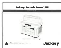
取扱説明書（日本語）